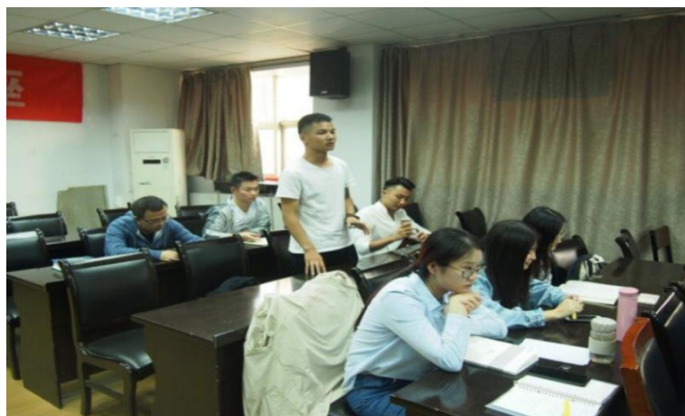
图文：人文与社会发展学院

最后，朱世桂教授就这次会议的主题做了精辟的总结。此次学术报告精彩纷呈，使我院学子受益良多。