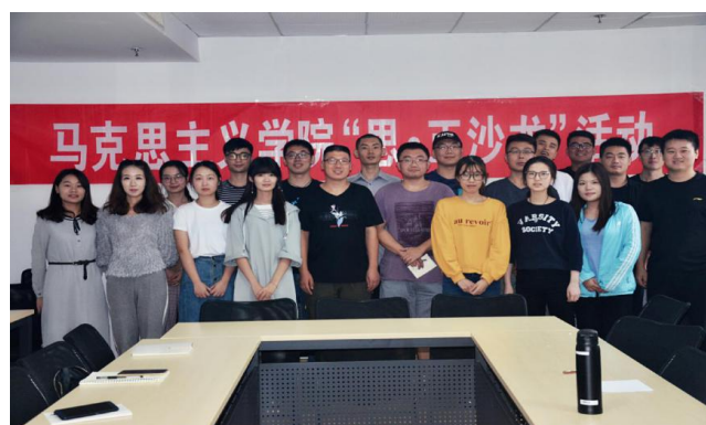
图文：马克思主义学院