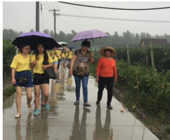
苏中分队走访姜堰现代产业园区葡萄种植大户