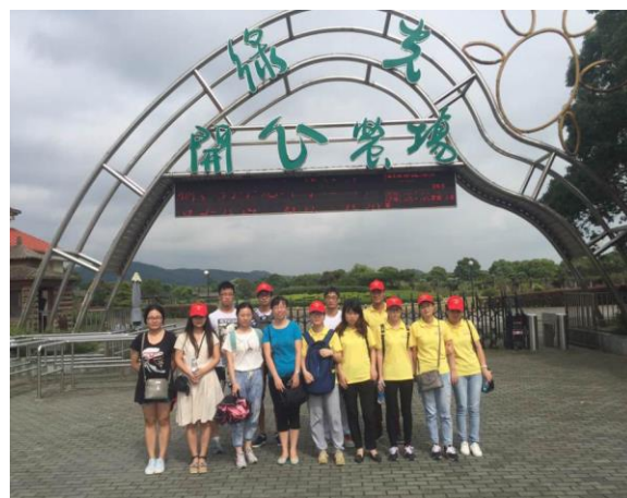
苏南西山农业园区分队成员合影