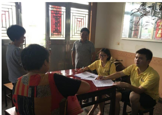
苏中分队走访农户，进行农技调查