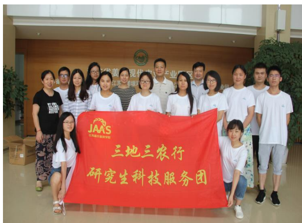
苏中姜堰区分队成员合影