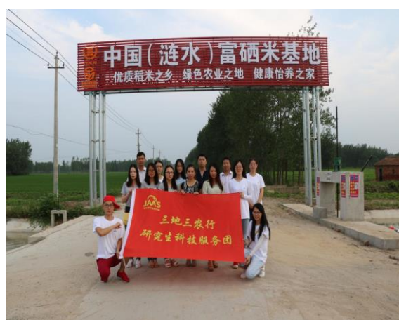
苏北分队参观涟水富硒米基地