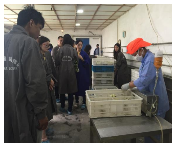
苏中分队在和盈鸡场参观鸡苗养殖