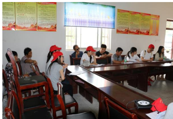
苏北分队在徐集乡王湾村进行扶贫调研