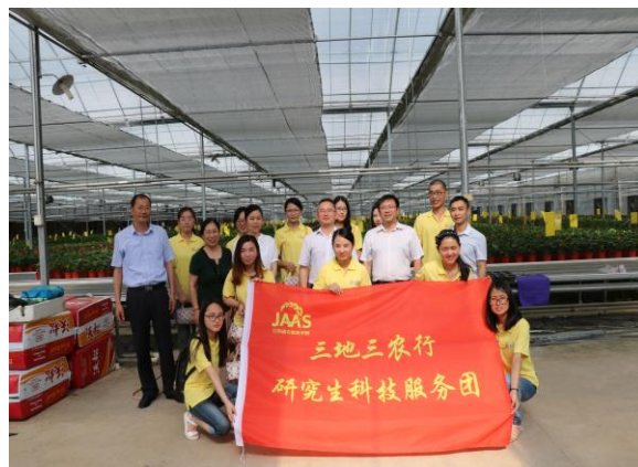
苏北涟水县分队成员合影