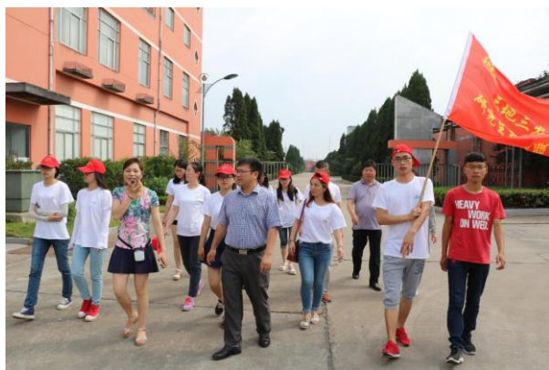
苏北分队参观今世缘酒厂