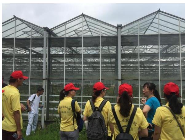
苏南分队在绿光农场了解其蔬菜种植