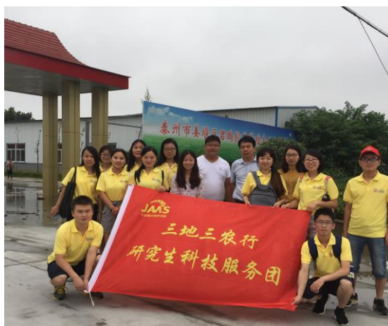
苏中分队参观君鹏鸵鸟养殖场