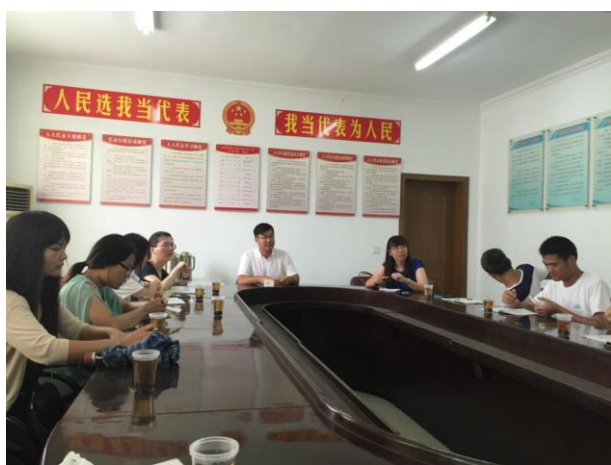
苏南分队参加衙里村村委会座谈会