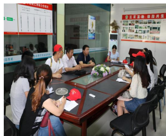
苏北分队在中达康农合作社座谈