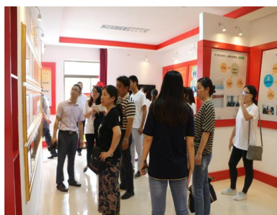
苏南分队在参观秉常村党建工作室