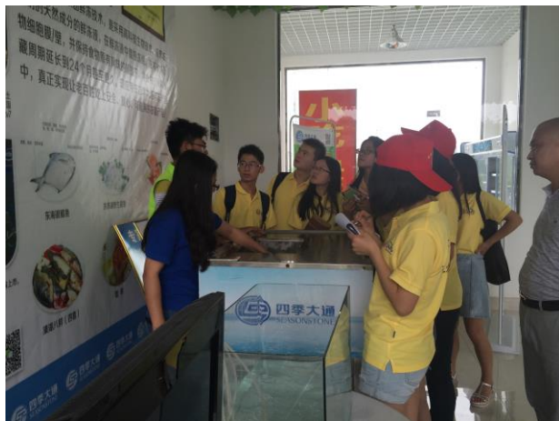
苏中分队在溱湖农产品汇听工作人员讲解微冻保鲜技术