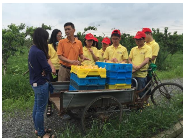
苏中分队在鲜乐美公司桃园就桃树种植与销售进行调研