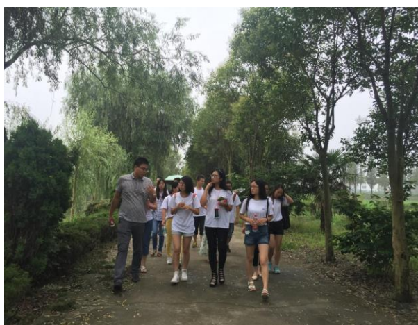
苏中分队在河横村进行生态建设、绿色循环发展调研